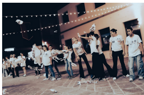
Bread and Roses B&R